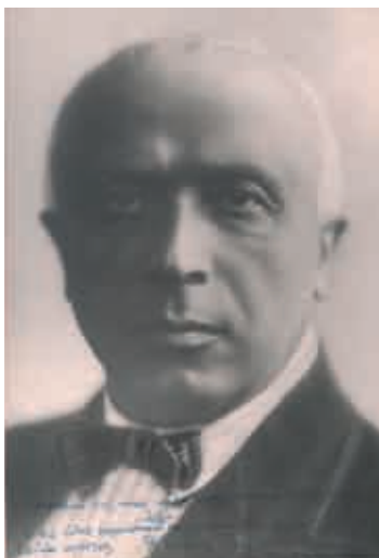
В. Н. Всеволодский-Гернгросс. 1949

На фото синими чернилами дарственная надпись Ленинградскому театральному музею: «Дорогому для моего сердца Ленинградскому Театральному Музею. Из всех видов театроведческой работы самой увлекательной была работа музейная. В. Всеволодский-Гернгросс. Москва. 10 января 1949 г.»