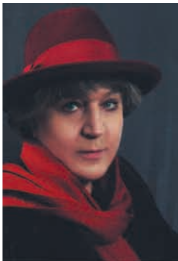
И. В. Евстигнеева. 1990-е