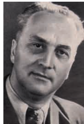
Кузнецов Е. М.

С 30 апреля 1949 г. Евгений Михайлович Кузнецов (1900–1958) — театровед, театральный критик, теоретик и историк эстрадного и циркового искусства — назначен директором музея. Его связывали с музеем давние отношения. Еще в юности началось его страстное увлечение театром. Первые документы с упоминанием Кузнецова, сохранившиеся в музее, относятся к 1922 г. Он был среди слушателей лекции В. Р. Рапапорта «Театральные достижения Москвы». Очень интересным и полезным для него оказалось знакомство с бывшим директором Императорских театров В. А. Теляковским. Из письма Теляковского от 15/1 1924 г.: «Кузнецов — молодой человек, бывший лицеист, теперь зав. театральным отделом «Красной газеты», тот самый, который понудил меня начать разрешаться от бремени моего писания. <...> Кузнецов — один из тех единственных людей здесь в Петербурге, который в курсе всей плодovitости моих работ, как бывших, так и настоящих. Он знаком со всем громадным количеством моего материала». Результатом их содружества стали опубликованные «Воспоминания», «Императорские театры и 1905 год», «Мой сослуживец Шаляпин» Теляковского под редакцией Кузнецова. Его интересовала не только история отечественного театра, но и его сегодняшний день. Евгений Михайлович — автор многих книг по истории театра, цирка, эстрады, книги о Горбунове, под его редакцией вышел